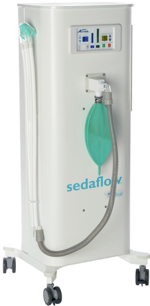
Standardfarbe: RAL 9016, weiß